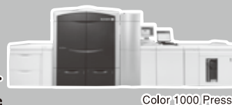
Color 1000 Press