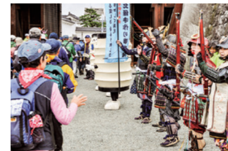
小田原北條手作り甲冑隊によるお見送り!