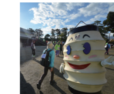
えっさほいファミリーに会いに行こう!